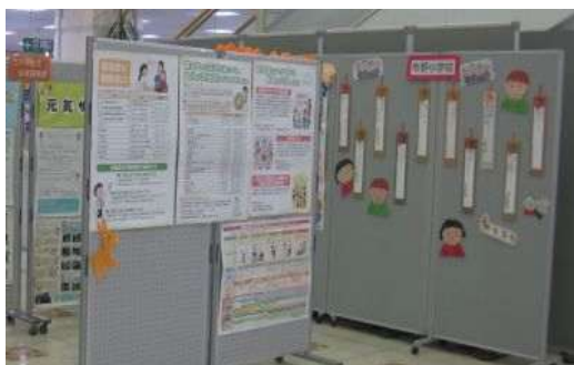
【認知症啓発パネル展】

*認知症ケアパスとは 認知症の症状進行に合わせた医療・介護サービスの利用ガイドマップのこと