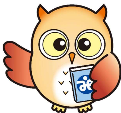
みよし社協キャラクター「福ろう」