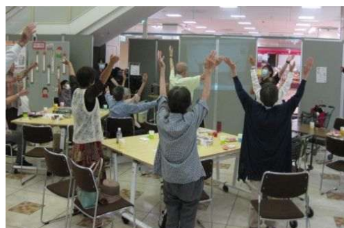
【虹色サロン オープンカフェ】