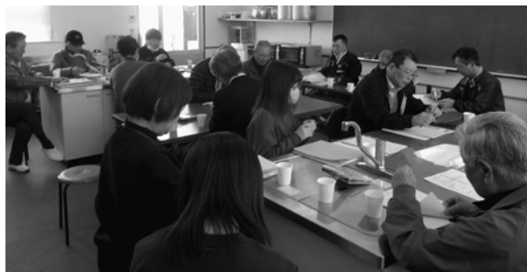
神杉地域ケア会議の様子

地域で困っていることについて、「地域」「子ども」「高齢者」の3つのグループに分かれて、「地域でできそうな具体的な取組み」について検討をしています。今後も関係団体がつながり、地域での取組みにつなげていきます。