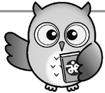
三次市社協イメージキャラクター 「福ろう」