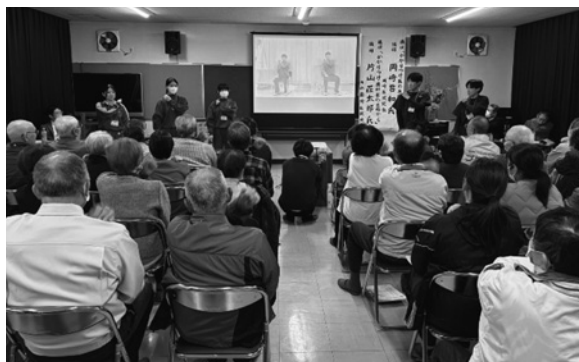
青陵高校生の体操の様子