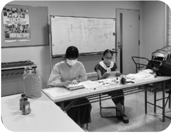
点訳ボランティア

7月24日～8月31日の間で「夏・ボランティア体験」を開催しました。福祉施設や市内のボランティア活動団体の体験を通して福祉に興味関心をもっていただき、お互いが支えあえる地域づくり活動につなげることを目的としています。各施設や団体で活動された様子について紹介します。