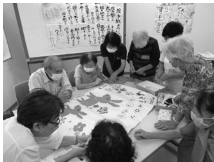
虹色サロン サンダグリーンでの様子