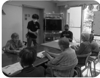
高齢者施設での介護支援