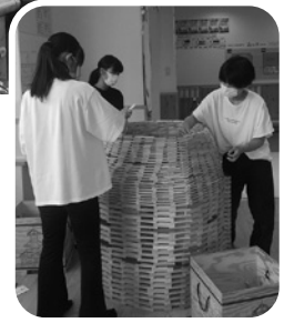
保育所や児童施設での保育補助