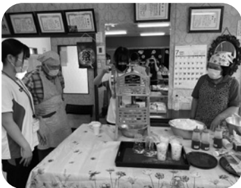
地域のサロンのお手伝い