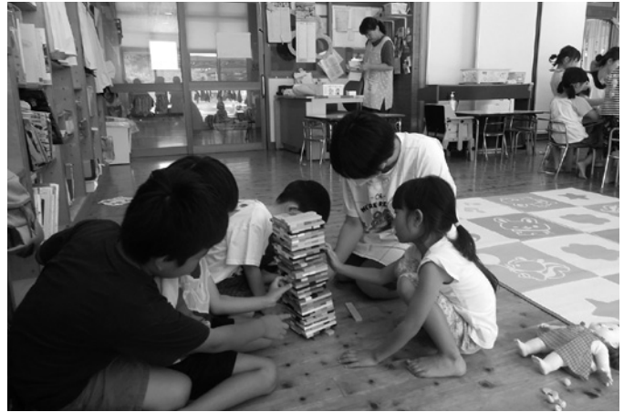
保育所での保育体験

令和2年から新型コロナウイルス感染症拡大防止のため休止していましたが、5類移行に伴い再開する運びとなりました。再開するにあたり、受け入れが難しい状況の中で多くの福祉施設、