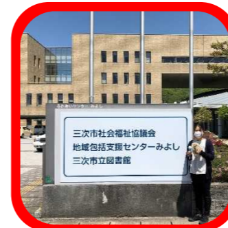
正門におおきな看板ができましたよ～