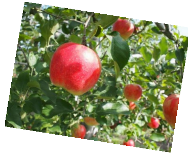
「フルーツランドふの」