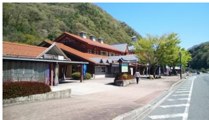
布野「道の駅ゆめランド布野」で昼食後 日頃の介護について語り合しましょう！